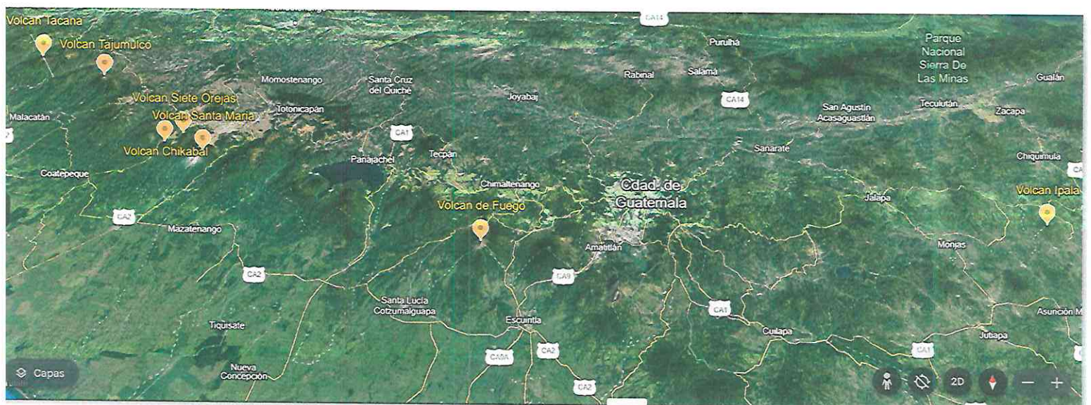
Volcanes Seleccionados.

Se busca destacar siempre la importancia de la convivencia con el volcán y de que forma se ha podido mantener un equilibrio entre la naturaleza y los asentamientos humanos existentes en sus faldas y valles.